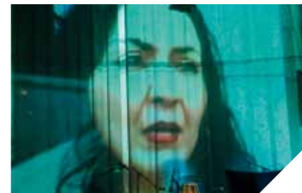
Filmklip vist under musikkensurkoncert på FN-dagen 2008