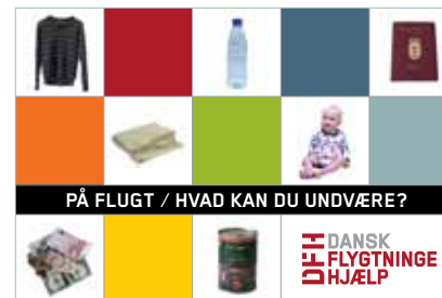
Postkort fra flugtdilemmaspillet "Hvad kan du undvære?"