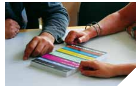
Antologien Verdenshistorier, udgivet på Gyldendal

Læs boganmeldelser af flygtninge-relevant skøn- og faglitteratur skrevet af frivillige i Dansk Flygtningehjælp.