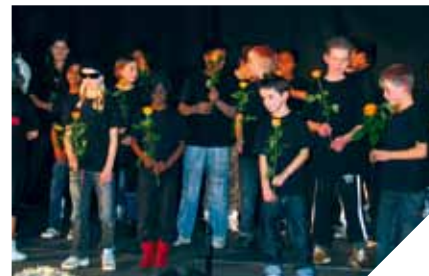
”Blandede Bolsjer” – et teaterprojekt om venskab lavet af frivilligruppen i Middelfart.