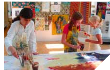
Kunstworkshop – amirzainorin.dk